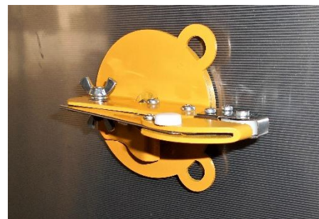
横で使用して、調理済み品の袋をカット