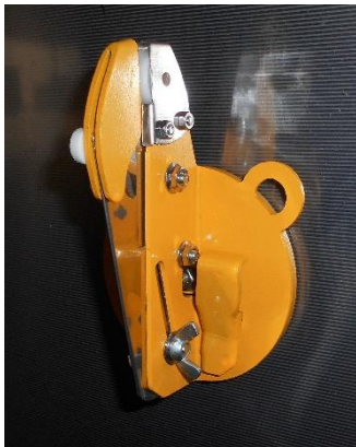
縦で使用して、紙パックをカット